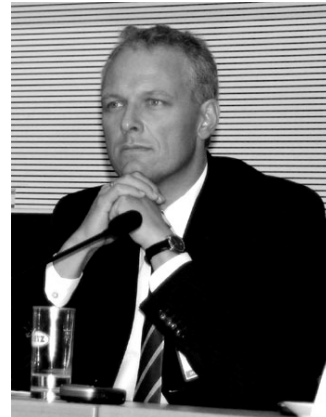
Ulrich Kelber, MdB

Die ländlichen Räume in Deutschland werden jetzt bereits seit Jahrzehnten marginalisiert. Die meisten Dörfer sind zu Schlafstätten verkommen, die besser ausgebildeten jungen Menschen zieht es in die Städte. Profitiert haben von dieser Entwicklung nur die Speckgürtel rund um die Ballungsräume und auch deren Position ist bei einer schrumpfenden Bevölkerungszahl hoch gefährdet. Denn der demographische Wandel in Deutschland droht die Marginalisierung der ländlichen Räume noch zu beschleunigen, wenn z. B. Infrastruktur etc. wegen schrumpfender Bevölkerungszahlen nicht mehr aufrecht erhalten werden kann.