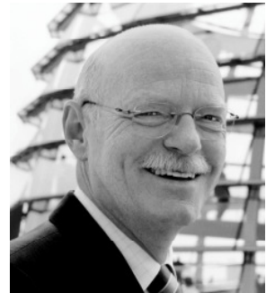
Dr. Peter Struck, MdB

die Politik für die Menschen in ländlichen Räumen steht vor großen Herausforderungen. Zwei Drittel der Menschen leben in ländlichen Gebieten. Mehr als die Hälfte der Wirtschaftsleistung der Bundesrepublik wird dort erbracht. Aber die demografische Entwicklung, knapper werdende öffentliche Finanzmittel, veränderte Rahmenbedingungen für die Landwirtschaft und auch die Abwanderung junger Menschen - hier vor allem junger Frauen - macht eine Auseinandersetzung mit den zukünftigen Entwicklungspfaden in ländlichen Räumen dringend erforderlich. Wir nehmen die Herausforderung an und laden Sie zur Diskussion ein. Dabei sollen auf dieser Konferenz folgende Themenschwerpunkte beleuchtet werden: